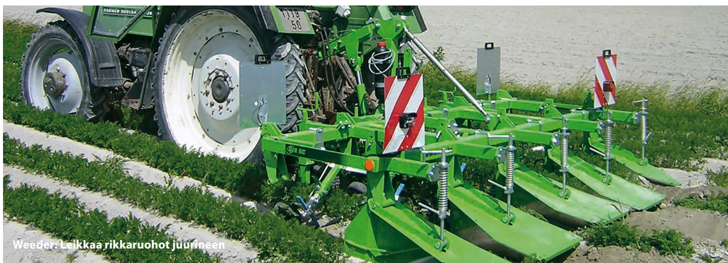
Weeder: Leikkaa rikkaruohot juurineen