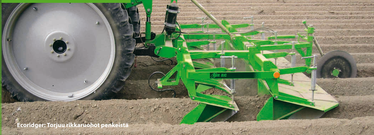
Ecoridger: Torjuu rikkaruohot penkeistä