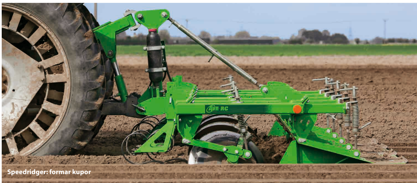
Speedridger: formar kupor