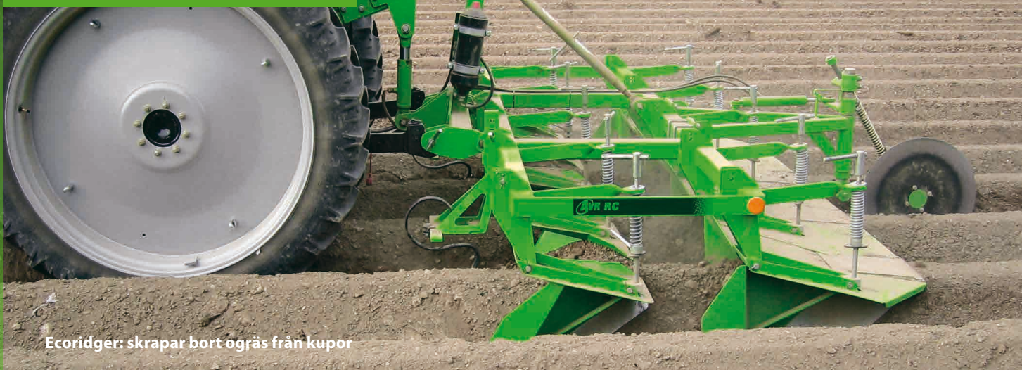
Ecoridger: skrapar bort ogräs från kupor