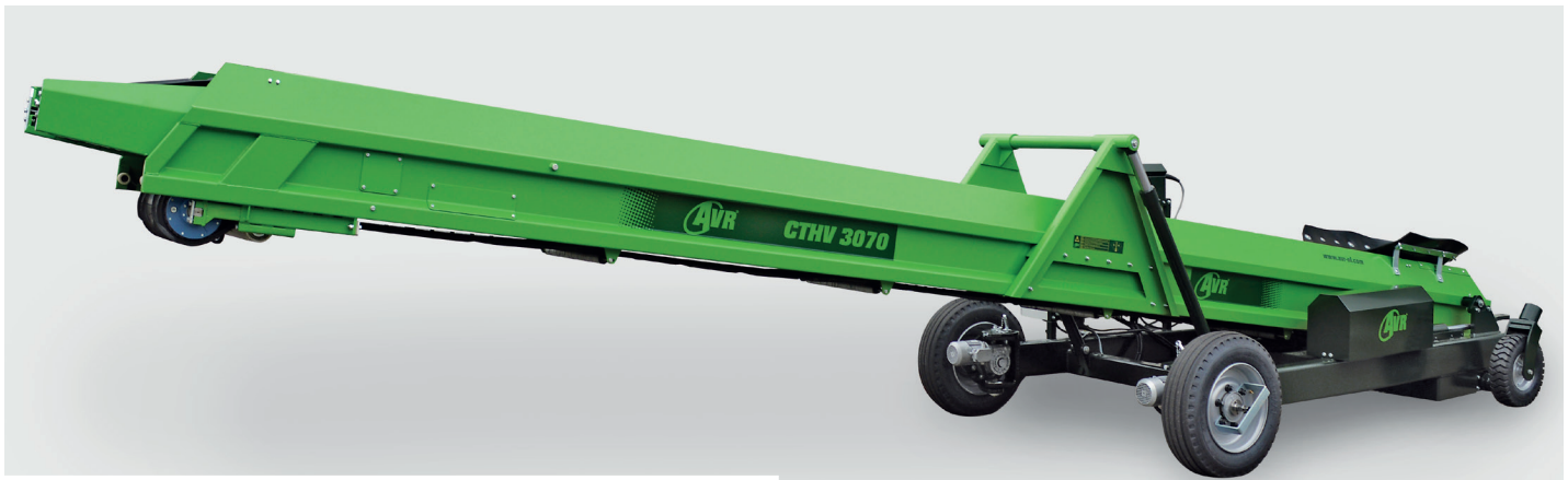
CTHV 3070 hallenvuller