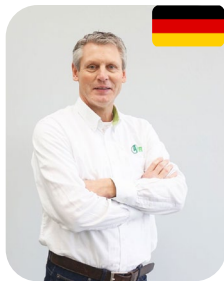
JAN JIPPES DUITSLAND OOSTENRIJK ZWITSERLAND

+32 (0) 476 40 56 75 pierreseutin@avr.be