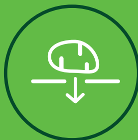
SADZARKI DO ZIEMNIAKOW