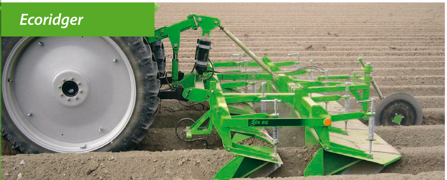
Ecoridger : importante raspado de las malas hierbas presentes en los caballones