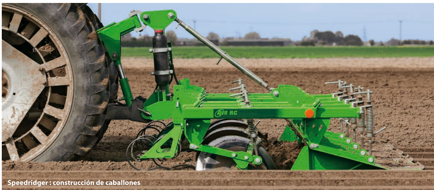
Speedridger : construcción de caballones