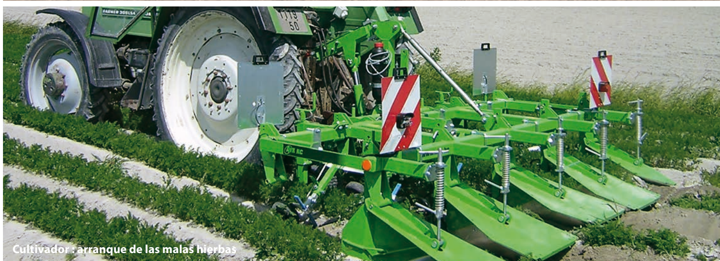
Cultivador : arranque de las malas hierbas