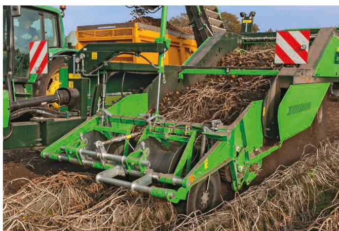
■ CAN-Bus bediening met joystick en controlebox