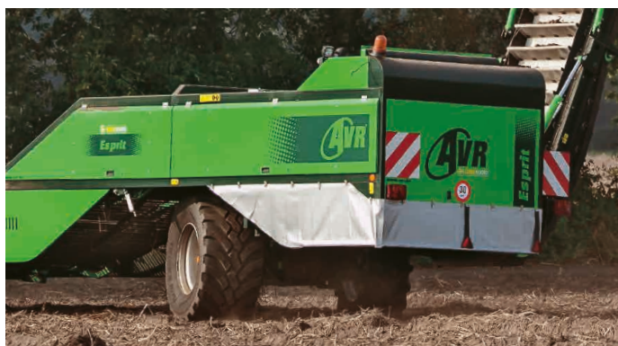
■ Automatische sturing op diablo