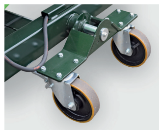
Tandemstel met zwenkwielen